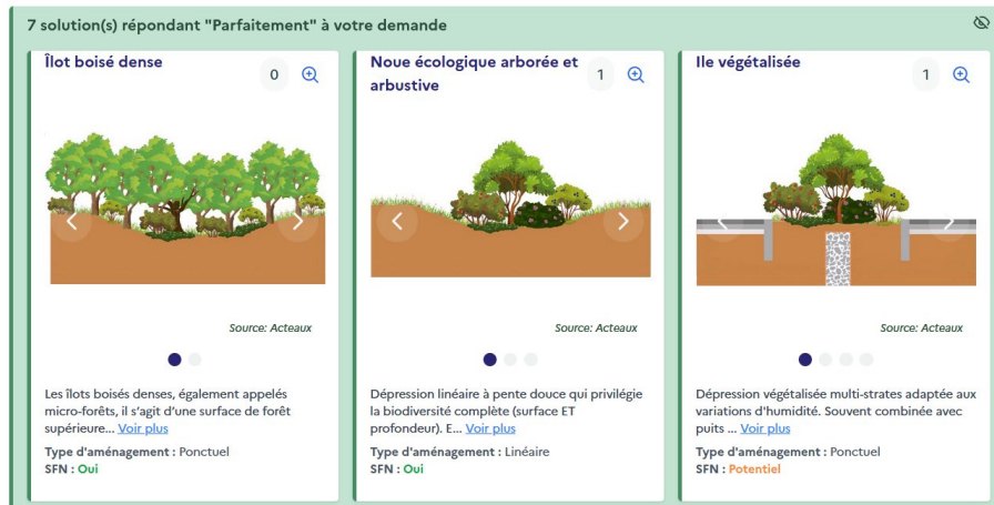
Résultats en matière de solutions de gestion des eaux pluviales en fonction des différents objectifs (version provisoire)

Suite à ses réponses, l'utilisateur a accès aux résultats d'aménagements de gestion des eaux pluviales. Ces solutions sont majoritairement des leviers d'actions pour l'adaptation au changement climatique. Pour chaque ouvrage, une définition et autres informations sont présentées tel que le niveau de potentiel d'accueil de la biodiversité,... Une fiche est également jointe.